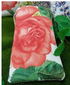
Handytasche zum Umhängen 24,90 €