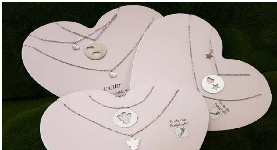
Familienkette 925 Silber: oben links Mama und 2 Töchter = 3 Ketten 109,90 € oben rechts: Mama , 1 Tochter, 1 Sohn = 2 Ketten 94,80 € unten Schutzengel für Mama und Tochter/Sohn = 2 Ketten 84,80 €