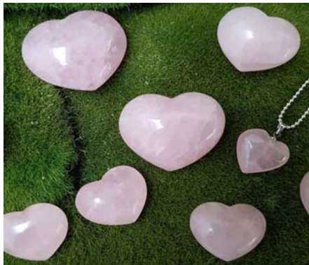
Rosenquarz Taschenherzen groß 14,90 €, klein 4,90 €