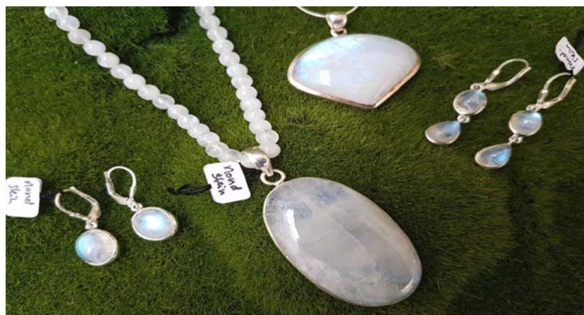
Serie aus 925 Silber mit Mondstein: Ohringe oval 49,90 €, Ohringe Tropfen 59,90 €, Perlenkette Mondstein 59,90 €