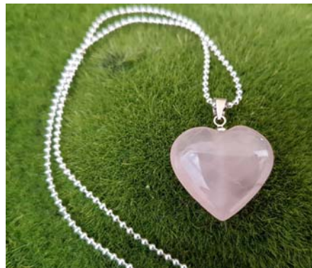
Rosenquarz Anhänger an Silberkette 24,90 €