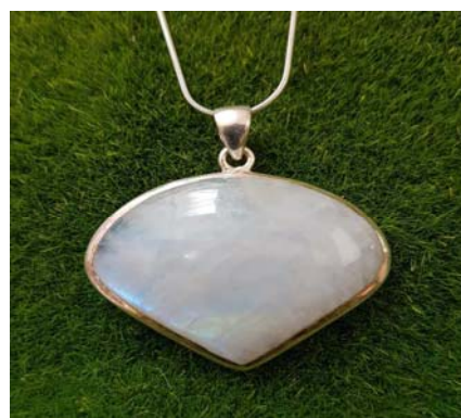
Anhänger Herzform 99 €