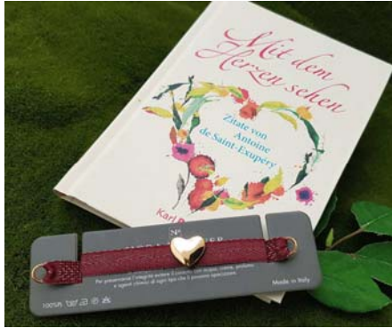
Armband mit Herzmotiv von Nora Pfeiffer Milano (24,90 €)

symbolischer Ausdruck der Liebe und des Lebens