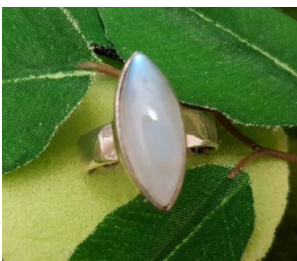
Ring spitzoval 49,90 €