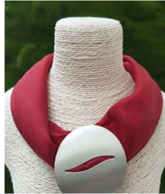
längenverstellbar durch Knoten 29,90 €