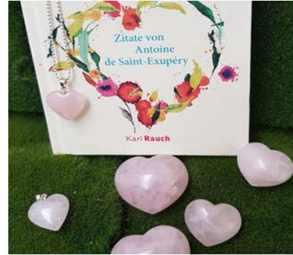
Zitate-Buch von Antoine de Saint-Exupéry 10,00 €