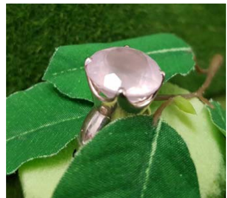
Ring 69,90 €

Serie aus 925 Silber mit Rosenquarz: Kette für Anhänger 925 Silber oder facettierte Turmaline