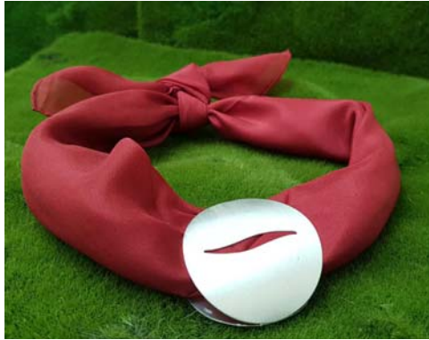
Seiden-Nicki-Tuch mit versilbertem Schmuckornament zum Auswechseln (

repräsentiert Liebe, Leidenschaft und Lebensfreude, schenkt Vitalität in vielen Kulturen gilt sie als Farbe des Glücks und Reichtums