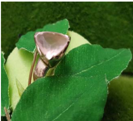
Ring 9,90 €

Hierfür ist der Rosenquarz die ideale Stärkung