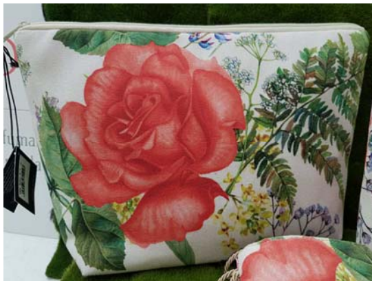
Kosmetikbeutel 29,90 €

„...geh die Rosen wieder anschauen. Du wirst begreifen, daß die Deine einzig ist in der Welt... ...sagte der Fuchs zum Kleinen Prinzen... (Antoine de Saint-Exupéry)