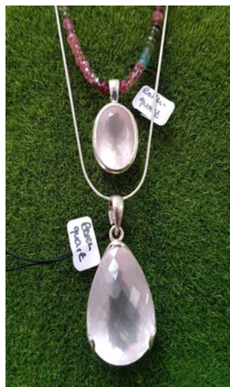
Anhänger oval 99 €, Tropfen facettiert 169 €