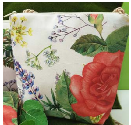
cross over Handtasche 39,90 €