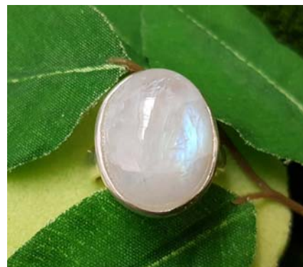
Ring oval 79,90 €