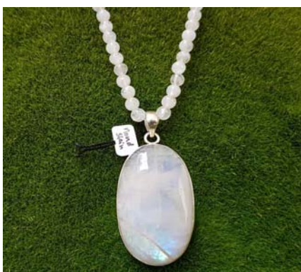
Anhänger oval 129 €

ist der ideale Stein für Frauen Er schenkt Lebenskraft, Heiterkeit, Ausgeglichenheit und verleiht eine jugendliche Ausstrahlung, stärkt außerdem Liebe und Einfühlungsvermögen