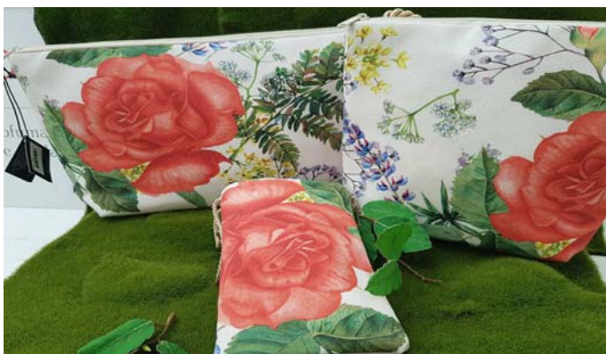
aus hochwertigem Textil-Jacquard von Belly Moden