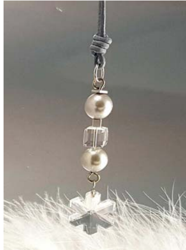
Anhänger am Lederband