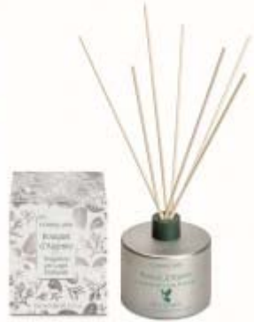
Bouquet D'Argento Raumduft