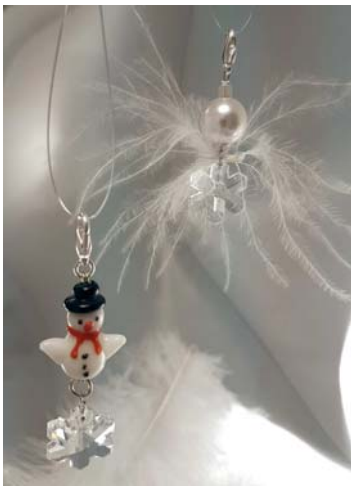
Anhänger für Kette oder als Sonnenfänger

und unser Schneekristall von Swarovski glitzert mit dem Schnee um die Wette