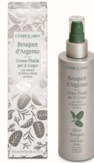
Bouquet D'Argento Körpercreme