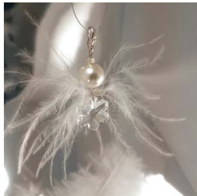
Anhänger Schneeflöckchen mit Swarovski-Kristall