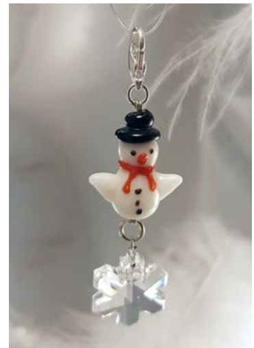
Anhänger Schneemann mit Swarovski-Kristall