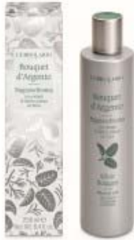
Bouquet D'Argento Duschgel

feiner klarer heller Duft von Blüten mit Silbernuancen