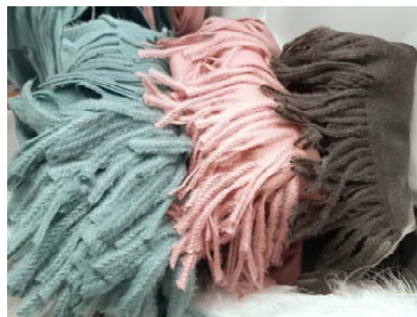
Viskose/Kaschmir 70 x 180 cm