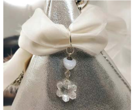
Anhänger am Seidentuch