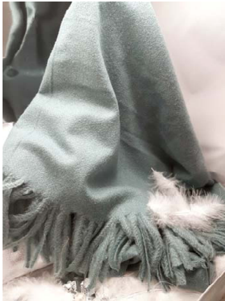
flauschiger Schal reicht gut über die Schultern