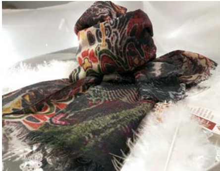
leichter Wollschal Wolle/Seide