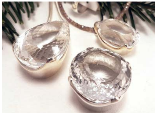
Bergkristall + 925 Silber Energie- und Lichtverstärker der ‚Masterhealer‘ unter den Heilsteinen