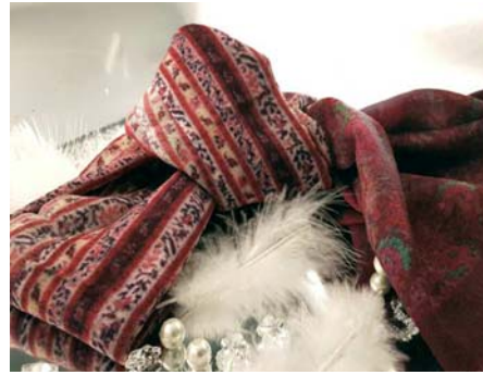
leichter Wollschal Wolle/Seide