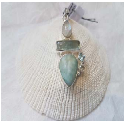
Larimar – Aquamarin - Mondstein