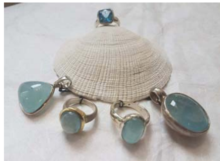
Aquamarin + Topas blau