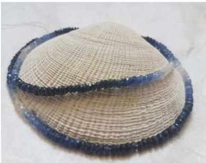
Saphirkette im Farbverlauf

wie wäre es mit diesen attraktiven Schmuckstücken in blau?