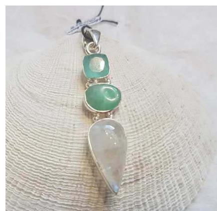
Mondstein - Chrysopras