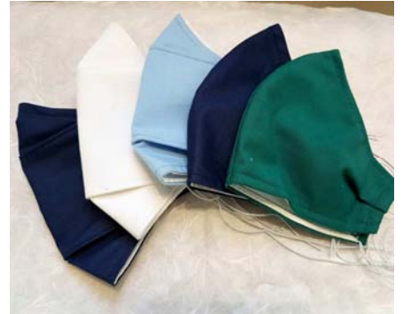
Gesichtsmaske in Aquatönen