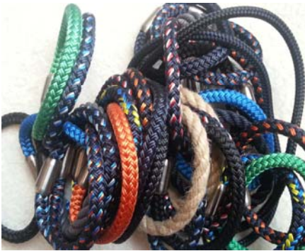
Segeltau-Armbänder von Fischers Fritze

oder mit anderen schönen Dingen, die Urlaubsstimmung machen?