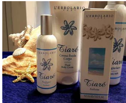
L'ERBOLARIO feine Duftpflege Tiaré-Blüte