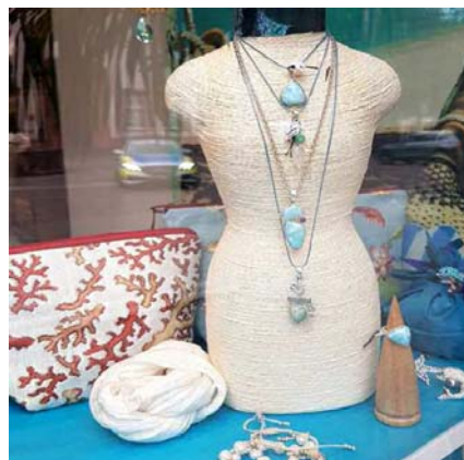
Mondstein - Chrysopras